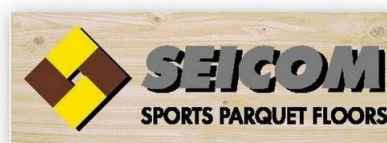
Modello "PVC AIR FLEX"

AIR FLEX è il nuovo supporto elastico in neoprene che nasce dalla grande esperienza Seicom nella realizzazione di parquet per lo sport, oltre alle soluzioni in legno massello e stratificato abbiamo creato due nuove versioni in PVC e GOMMA, una novità assoluta per seicom. Pensiamo che questo sia stato apprezzato dai visitatori che hanno avuto il piacere di visitarci.